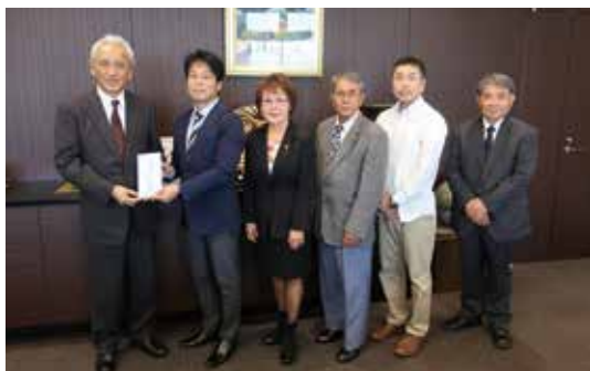
同窓会役員が地元2紙を訪れ首里城再建義援金を託した