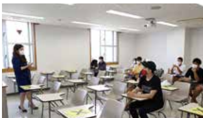
対面授業では学生どうしの距離に配慮

6月1日から演習や実習など一部の対面授業が開始され、そのほかの講義についても感染防止に配慮しながら段階的に開始した。沖縄大学では、今後予想される新型コロナウイルスの第2波、第3波に警戒し備えながら、しっかりと学生の学修を支援していく。