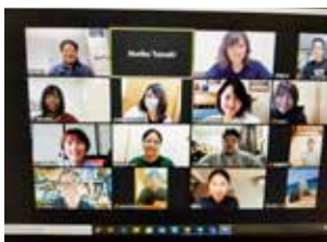
ネットを使った遠隔授業

感染予防対策に努めながら1週目は各学科・研究科でオリエンテーションや履修登録ができたが、その後感染者の増加に伴い、4月10日以降は講義を自宅学習や遠隔授業に切り替えた。沖縄大学では早い段階から遠隔授業についてマニュアル作成などを行い、ZoomやTeamsといったオンラインツールを利用して、教員と学生がコミュ