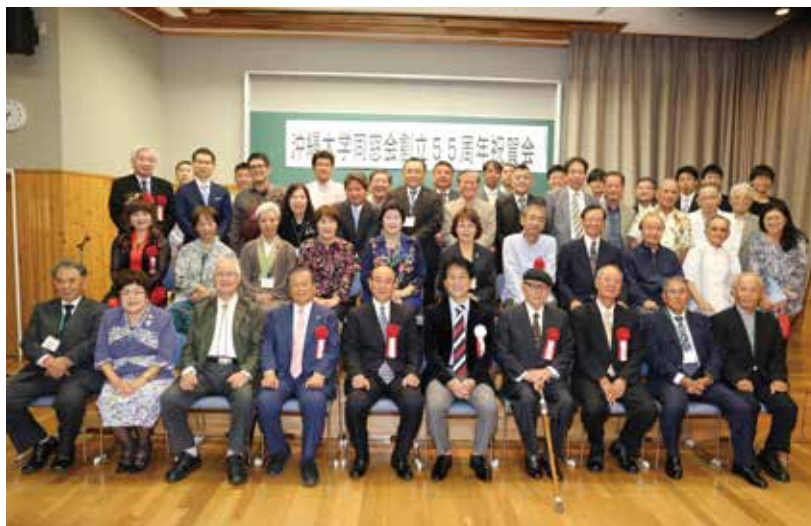
同窓会創立55周年祝賀会