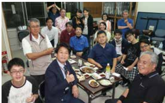
青年部主催在学生との交流BBQ大会